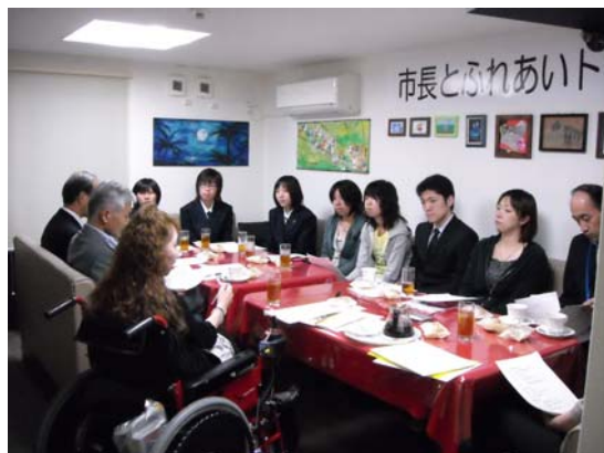
テーマ:バリアフリー( )v

←第3回「市長とふれあいトーク」 2008/06/24(火) 会場 喫茶「じゅの」