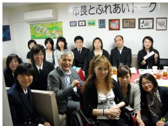
「トーク」が終って、みんなで「パチリ」