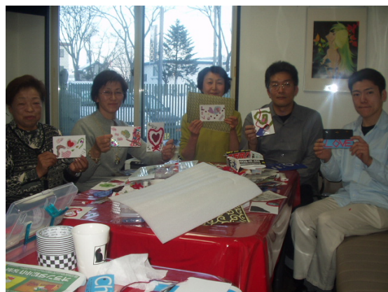
出来上がった作品を持って、ポーズ♪