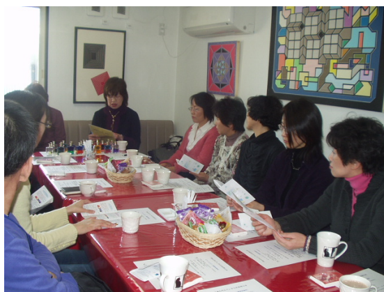
真剣に聞いてます