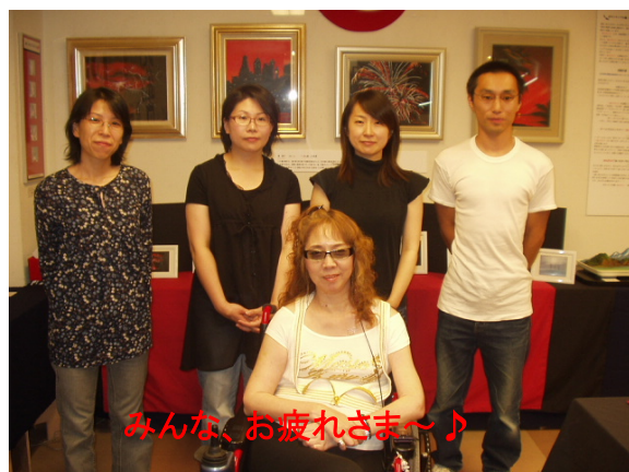
みんな、お疲れさま〜♪