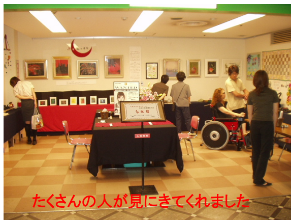
たくさんの方が見に来てくれました