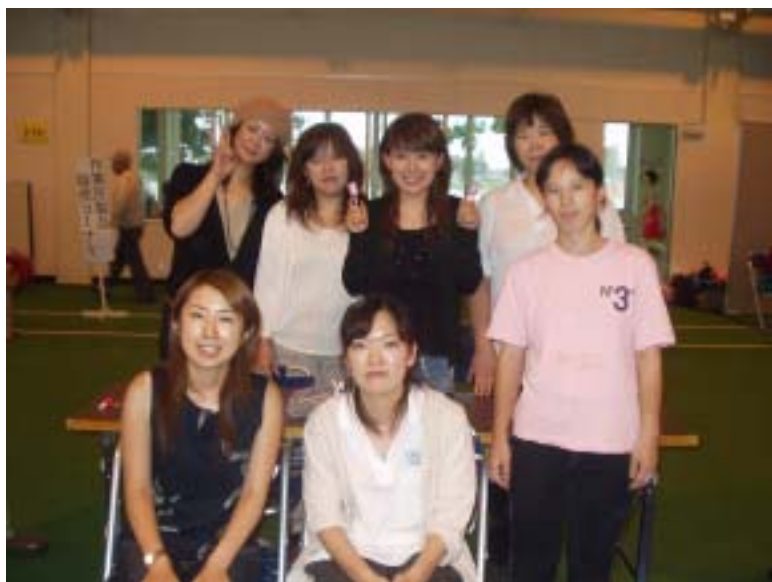
『ふれあい交流まつり 2005』

これからも、いろんな活動に参加し、いろんな経験をして、いろんなコトに気づけるようになりたいと思います(*^-^*)>