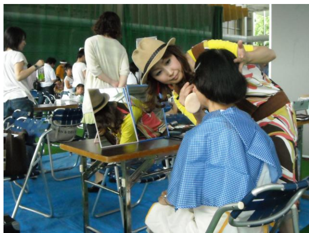
メイクのプロ！波佐ちゃんも助っ人に…。(^^)v