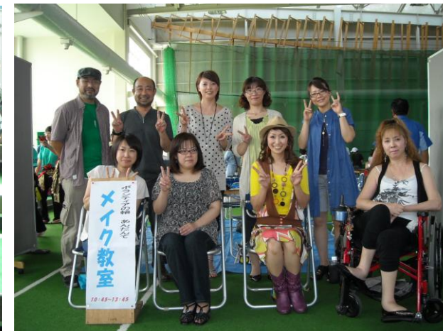
恒例の記念撮影「ハイ、チーズ♪」(^o^)