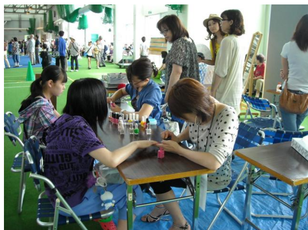
今年も子供たちがいっぱい来ました～♪(^o^)/