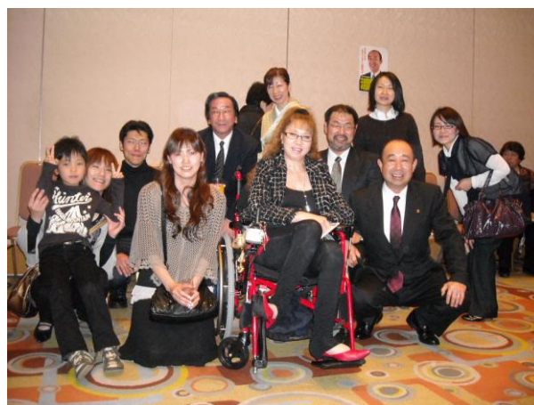
記念撮影！カメラマンはF内藤！(^o^)/