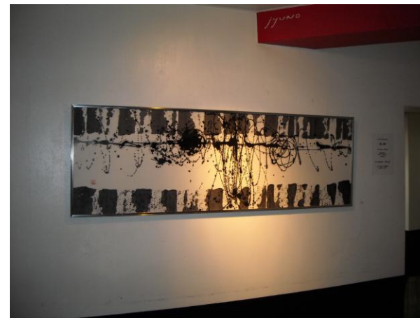
タイトル「鼓動」とても迫力があります！(*_**)v