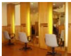
(スブランドール店内)